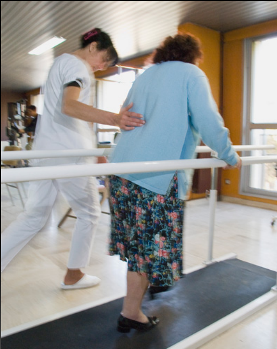
Soins de Suite et de Réadaptation (SSR)