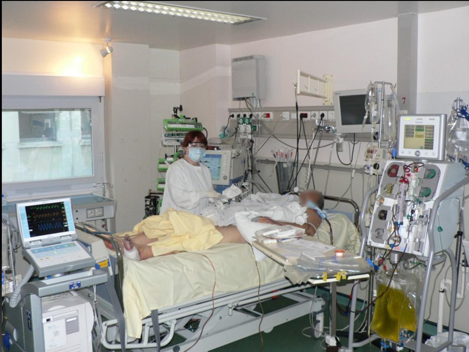
Service de réanimation