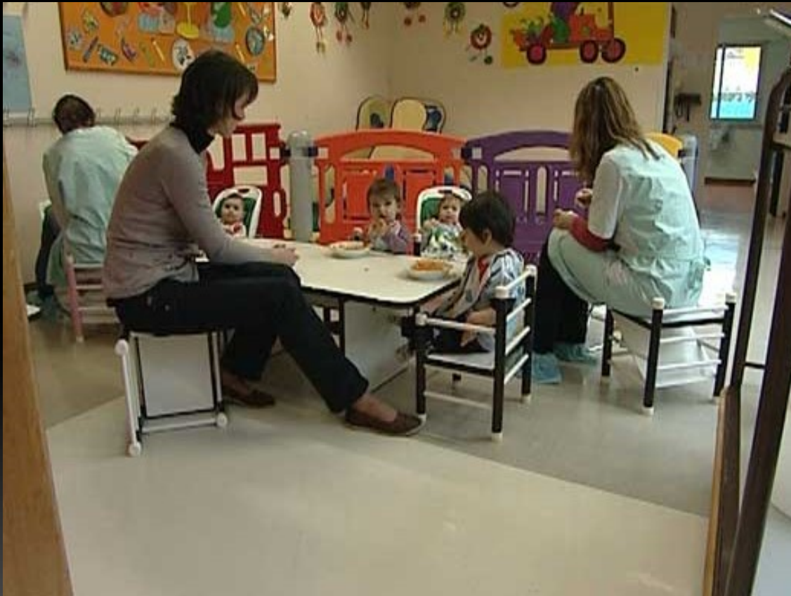
Infirmière en crèche