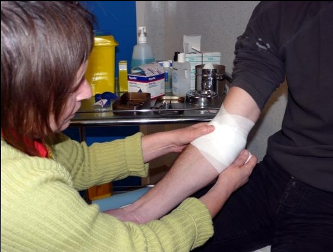
Centre de soins infirmiers