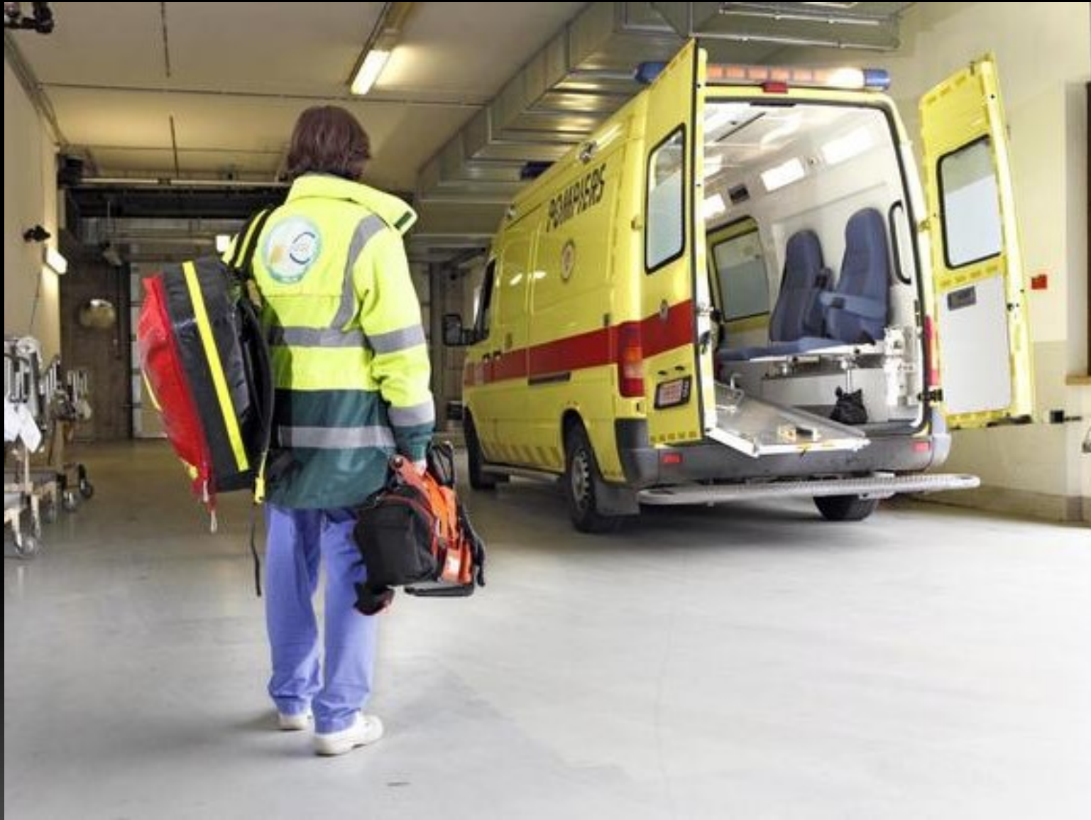
Service Mobile d'Urgence et de Réanimation (SMUR)