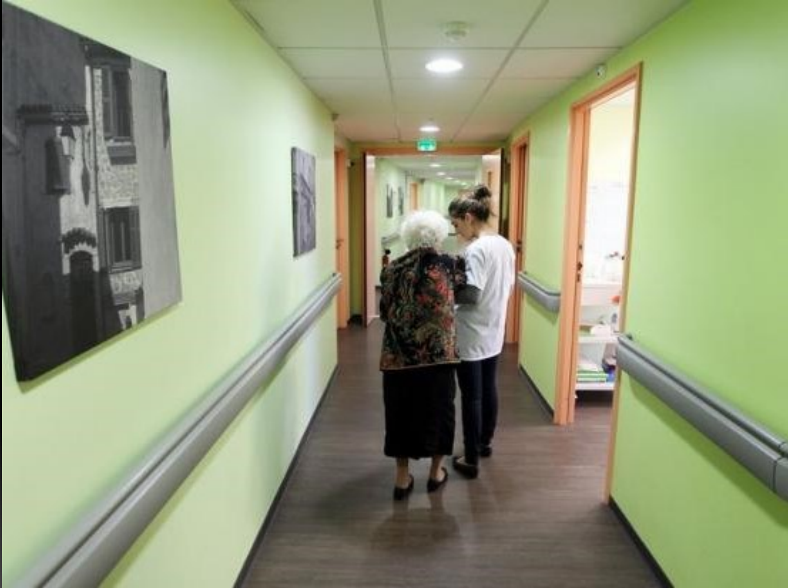
Maisons de retraite privées