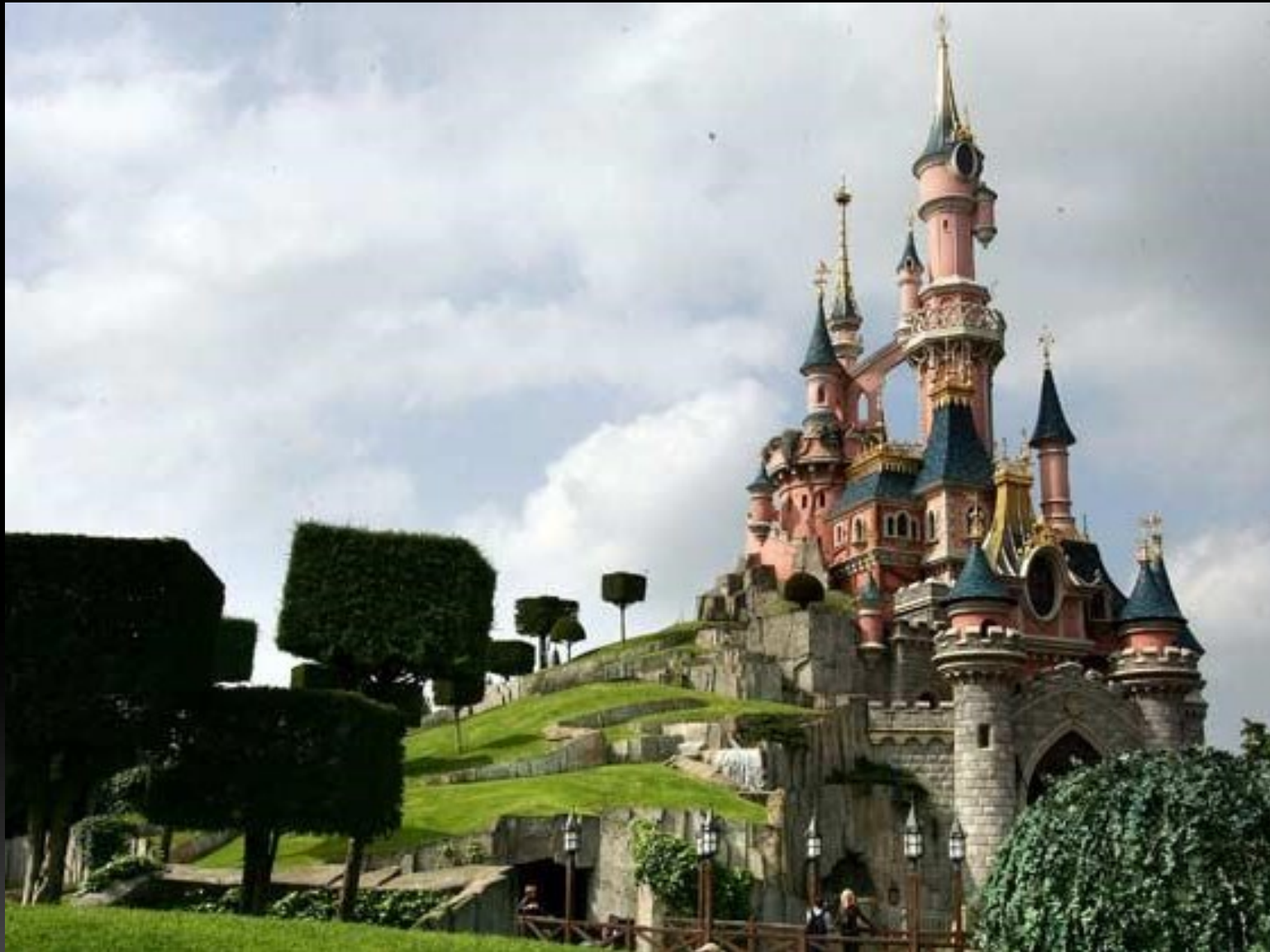
Parcs de loisirs