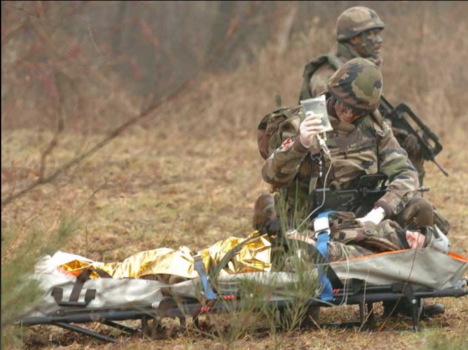
Infirmier militaire, infirmier réserviste