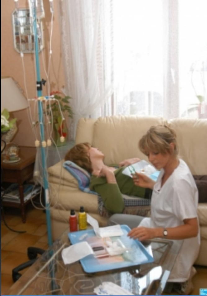
Hospitalisation à Domicile (HAD)